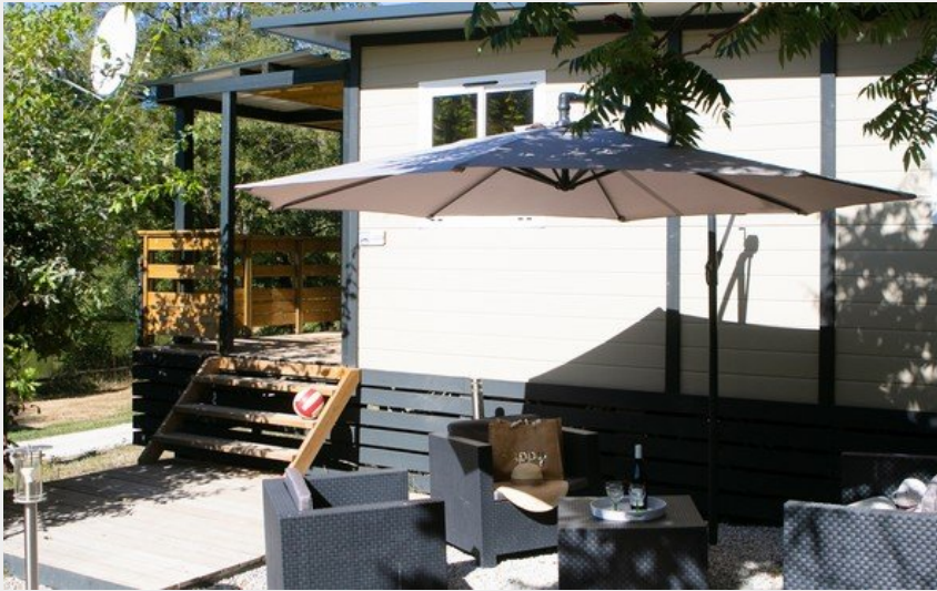
Crédit photo : Chalet Luxe 6 personnes camping Fougeraie (camping Fougeraie)