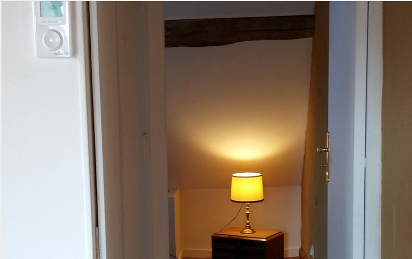
10. Passage du séjour vers la chambre 1