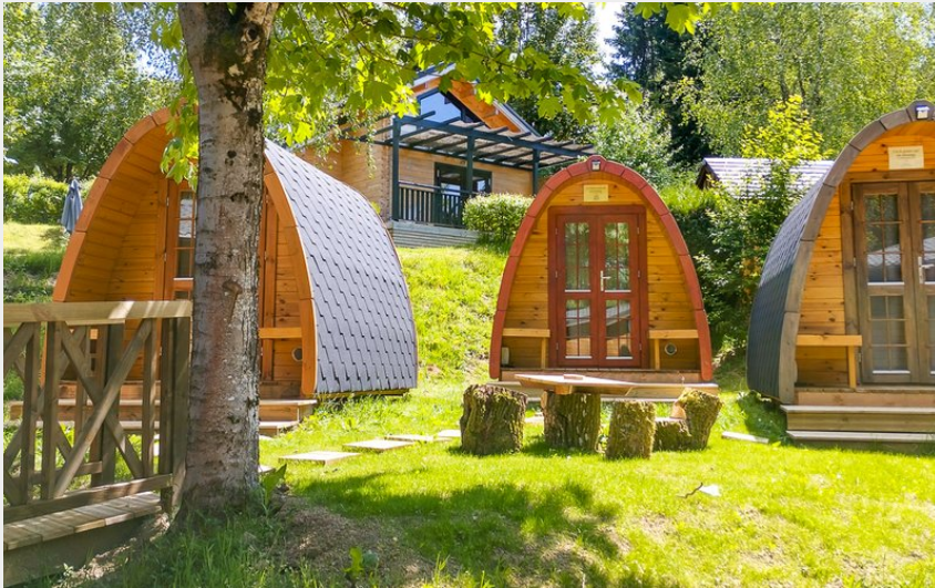
Crédit photo : 5 pods dans le jardin, lit double ou 2 lits simples (La Cabane Verte)