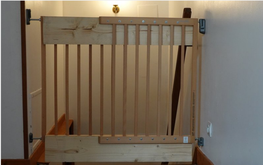
Barrière anti chute. Les Meulots, parc naturel du Morvan, Bourgogne