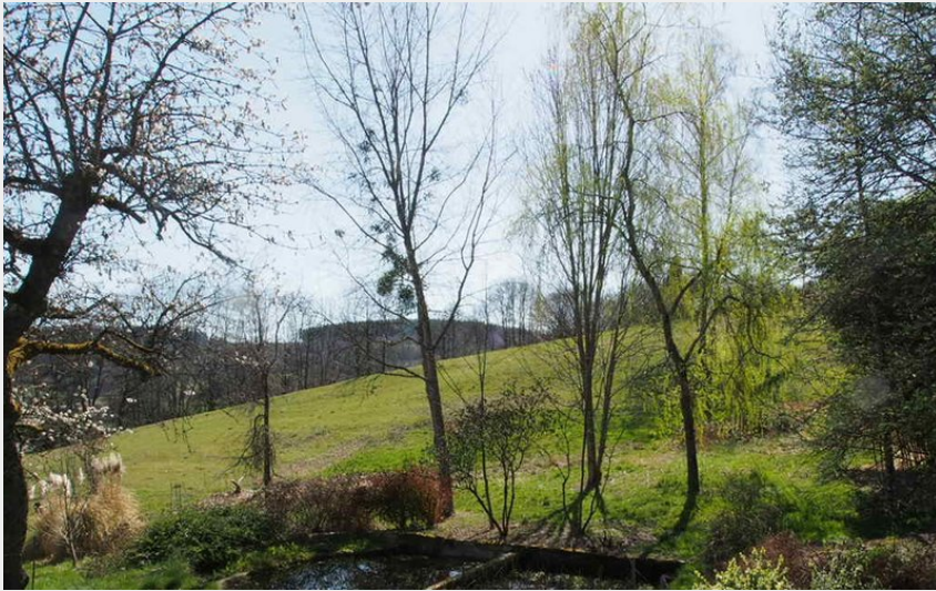
Crédit photo : Vue sur le point d'eau depuis la terrasse (Charlotte Henry)