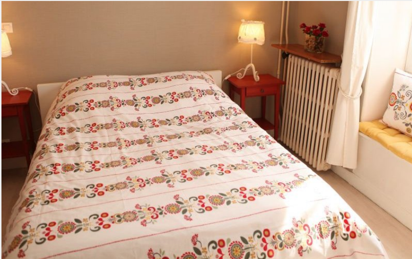
meublés renauderie_St Honoré les Bains (1)