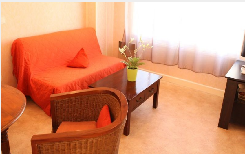
Crédit photo : meublés thermalis-St Honoré les Bains (1) (©Mme Pangaut)