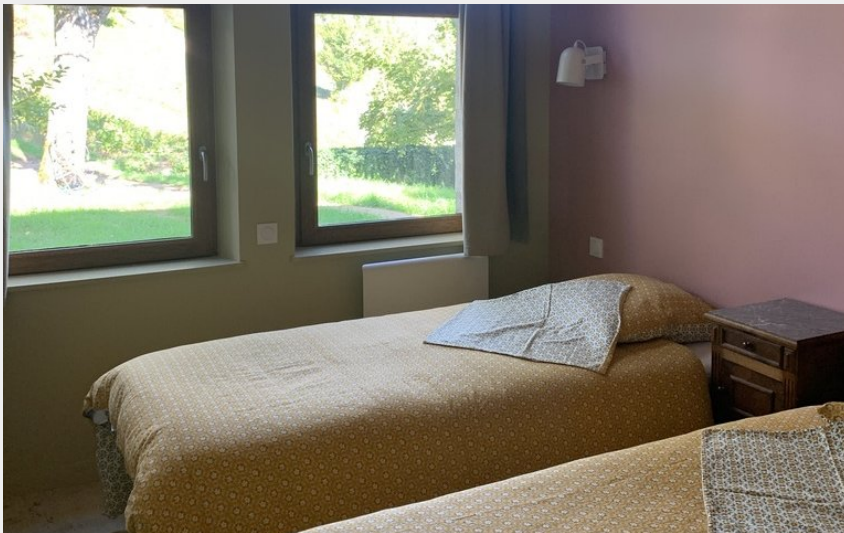
Crédit photo : Chambre Rose - lit kingsize ou 2 lits simples (closdestilleulsvezelay)