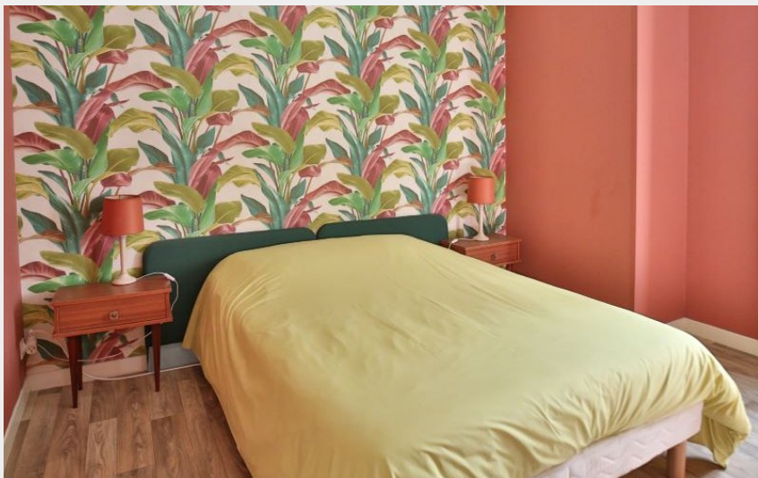
Gîte - Espace 3 Chambre 1 - 2 personnes