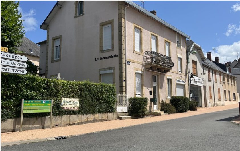
Crédit photo : Les roses façade (Résidences de Saint-Honoré-les-Bains)