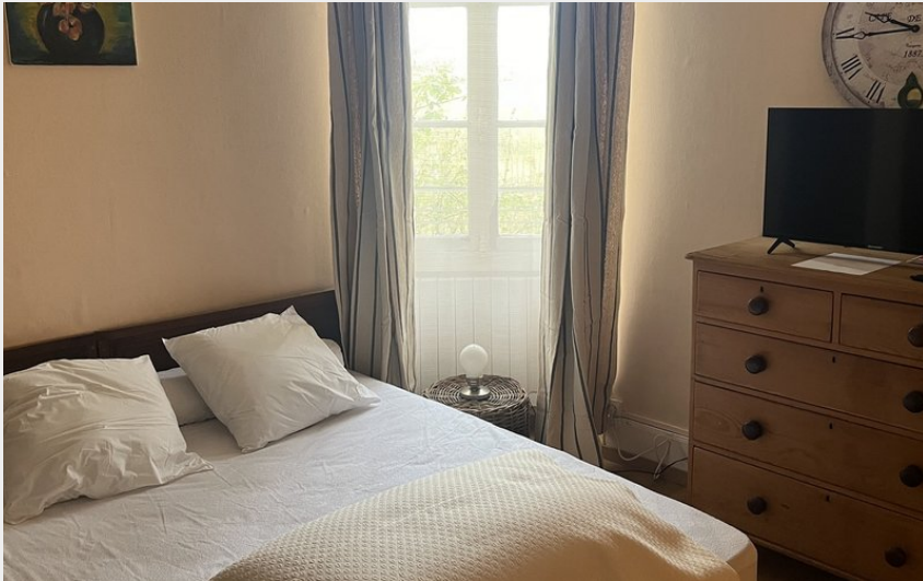
Crédit photo : Chambre log 3 Villa fleurs (Résidence de Saint-Honoré-les-Bains)