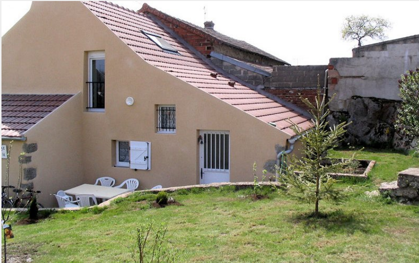
L'heritage 1903 au printemps