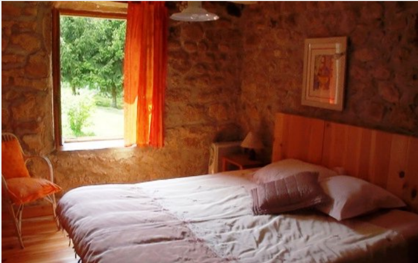
La chambre double (Le Moulin de la Louve)