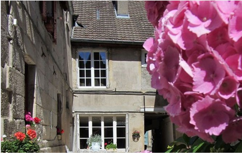
Crédit photo : vue sur cour (Gîte Berthe et Jacques/Patrice Bruley)