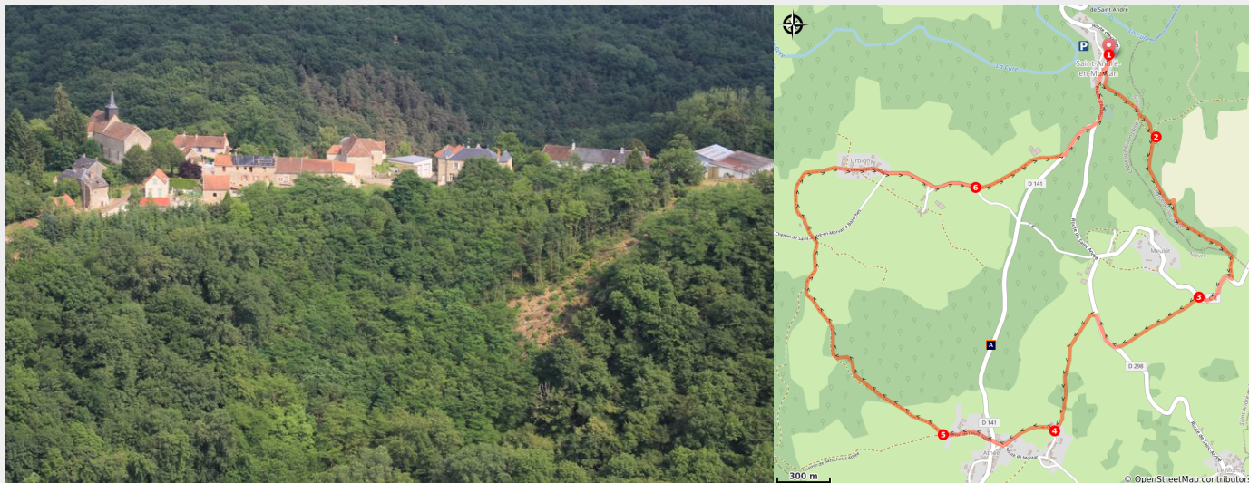
Saint-André en Morvan Vue aérienne