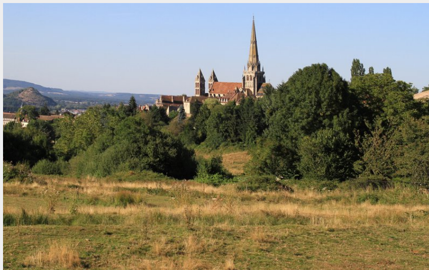
Paysage Autun