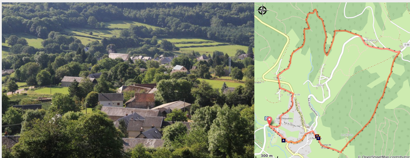
Paysage Anost (A Millot Pnr Morvan)

Petite boucle mais avec de forts dénivelés ... De beaux panoramas vers "Les Bigeards" sur le bourg d'Anost et les collines et vallées environnantes.