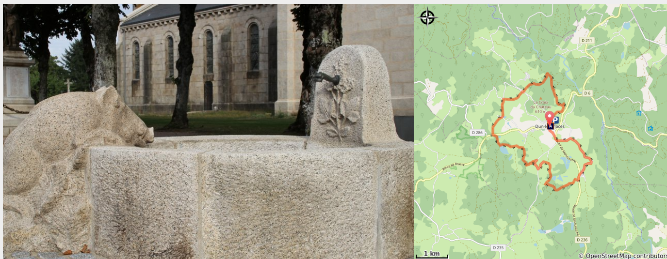
Fontaine Dun les Places (A Millot Pnr Morvan)