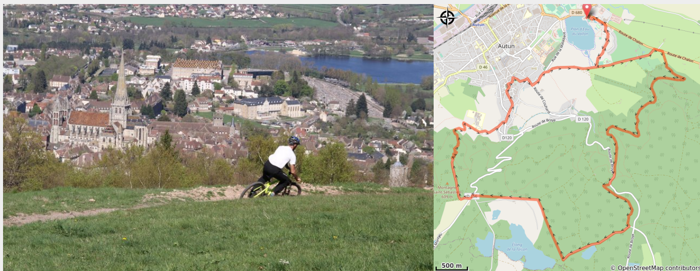
Paysage Autun (A Millot Pnr Morvan)