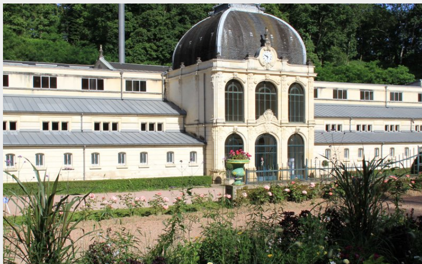
Les Thermes de Saint-Honoré les bains (Alain Millot)